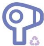
Appareils électriques et électroniques