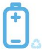
Piles et batteries

Pendant la semaine du développement durable, continuons à recycler ces produits :